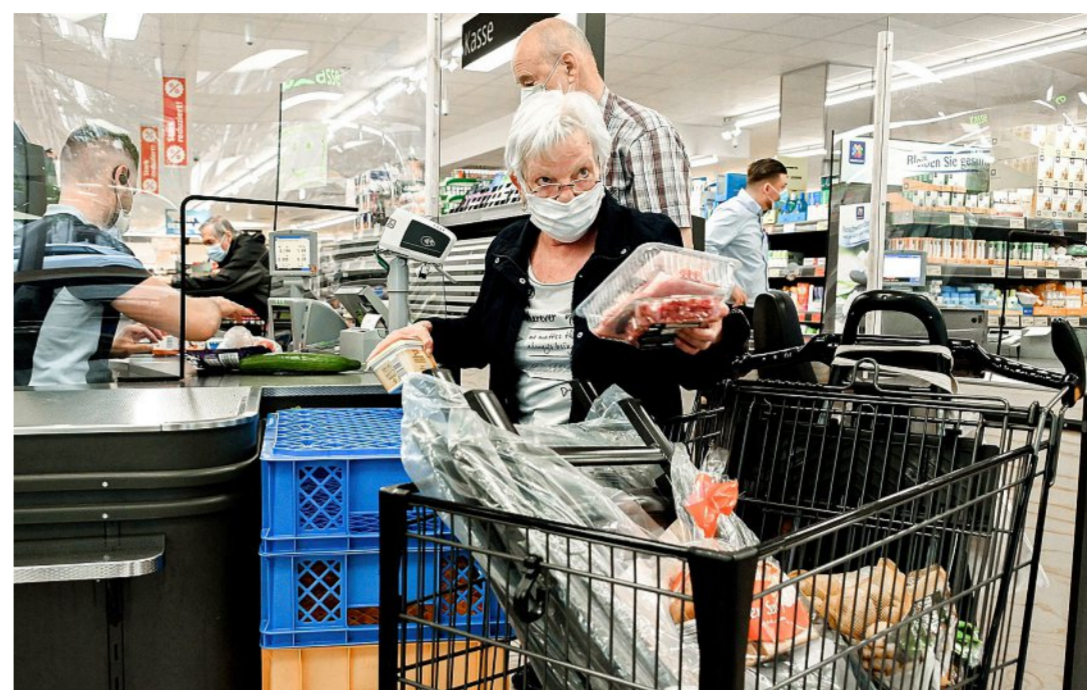
Pour qu'il soit efficace, le masque doit être positionné correctement.

Siégeant au comité cantonal de l'Union suisse des professionnels de l'immobilier, je tiens ici à témoigner des efforts sans borne de notre association et de nos membres pour, dès le début de la crise, encourager et alimenter les discussions entre nos clients propriétaires et locataires afin qu'une solution soit trouvée pour aider les commerçants dans le règlement de leurs loyers. Ainsi, au moment de rédiger ces lignes, ce ne sont pas moins de 3 millions de francs de loyer qui, afin de soulager la si-